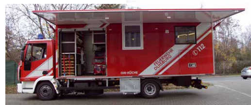
Fahrzeugbau heute: Küchenfahrzeug